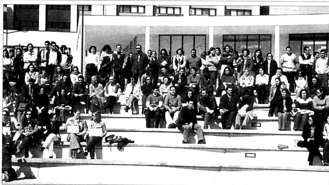
■ Estudiantes de la UJI protagonizan un paro silencioso de cinco minutos

La plataforma está integrada por asociaciones de vecinos, cul-