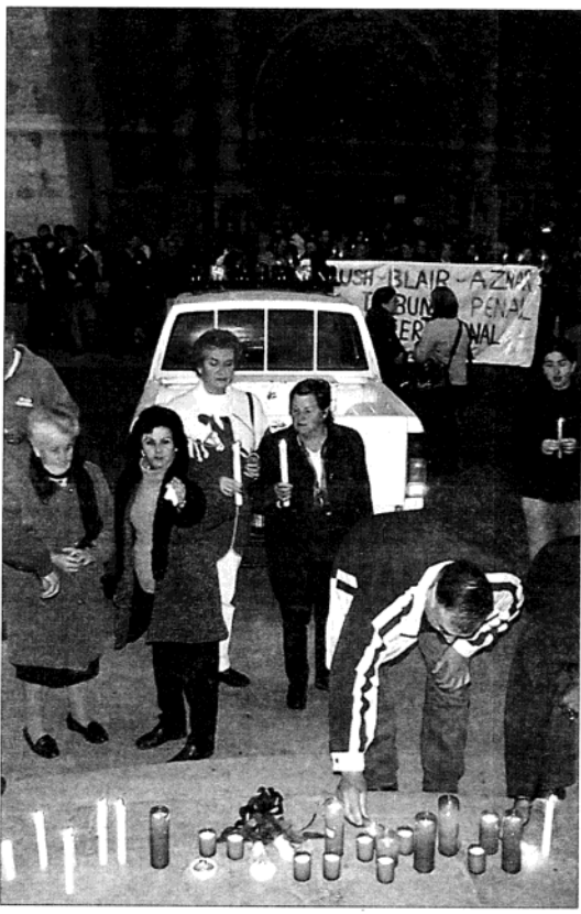
MULTITUD. La Universidad y los municipios de la provincia alzarón su grito contra el enfrentamiento bélico con Iraq.

turales, sociales y religiosas, sindicatos y todos los partidos políticos a excepción del PP.