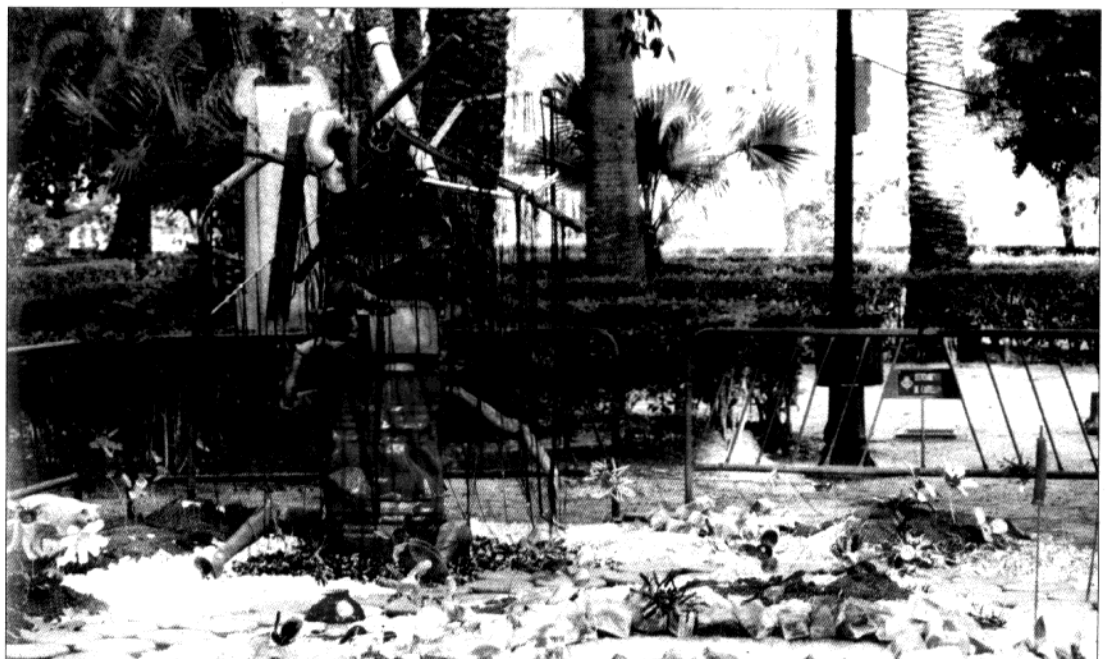
El grupo Reciclar presentó una pieza con plásticos, colores, papeles y cuerdas.

• El Sur , de Alain Campos y Vicent Vidal. El proyecto consiste en la disposición en el suelo de un conjunto de 3.000 botellas rellenas de agua coloreada que forman una rosa de los vientos. El aire, representado por la rosa, el agua y el vidrio como materia conformada por el fuego, se combinan en la tierra construyendo un símbolo donde el sur rige como alternativa frente al dominio del norte.