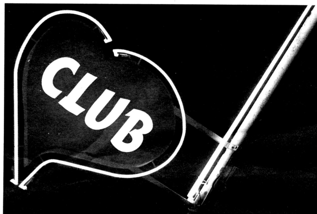
El negocio del sexo sigue en auge pero con las mujeres que lo ejercen igual de discriminadas.