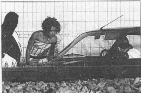
Dos prostitutas 'hacen la calle' en una zona de Valencia.