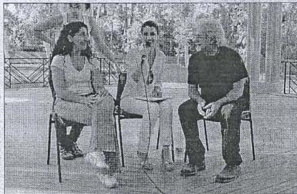
La actriz española Ruth Gabriel presidió el evento.