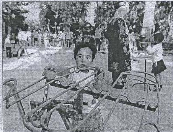
Los más pequeños disfrutaron con los juegos. ROBERT MUÑOZ