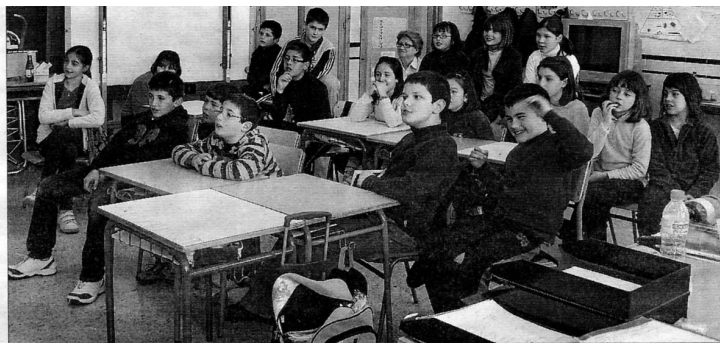
Los niños participaron de forma activa en la charla y comprendieron que todos somos iguales.