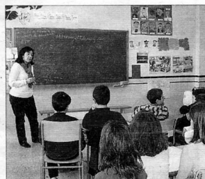
El centro seguirá trabajando en esta línea.