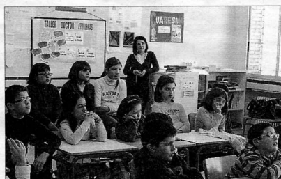
La intervención acaparó la atención de los escolares.