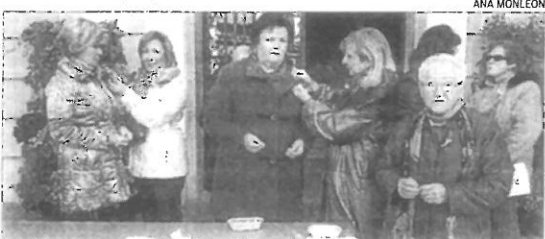
SEGORBE Reparto de 500 lazos blancos ▶ La asociación de mujeres de Segorbe repartió 500 lazos blancos entre todos los vecinos que se acercaron hasta la plaza del Agua Limpia.