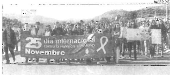
LA VALL D'UIXÓ Los jóvenes también cuentan ▶ Marcha matinal que protagonizaron los alumnos de los tres institutos de la Vall hasta la rotonda de los almendros donde se plantó un árbol.