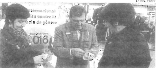
ONDA Calendarios informativos sobre 016 ▶ En Onda se repartieron lazos rosas y calendarios con información del servicio telefónico 016 de atención a las víctimas de maltrato.