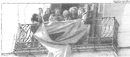
BENICARLÓ Unanimitat femenina ▶ Las concejales de Benicarló colgaron ayer un lazo de color violeta en la fachada del ayuntamiento y leyeron un manifiesto para rechazar la violencia.