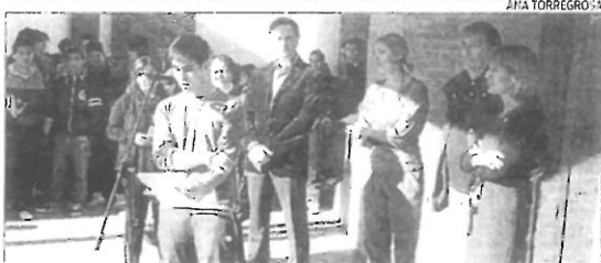
BENICÀSSIM Manifiesto en el IES Violant Casalduch ▶ El IES Violant de Casalduch de Benicàssim mostró su rechazo con la lectura de un manifiesto por parte de uno de sus alumnos.