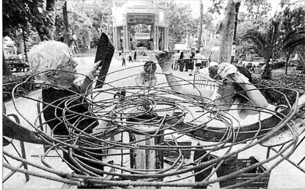
► Pere Ribera participó en la última edición de la bienal, en 2009.