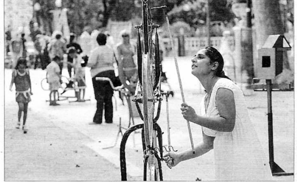
► Los creadores demuestran que la basura también puede ser arte.

VII BIENAL 'ARTE DEL DESECHO' EN CASTELLÓN