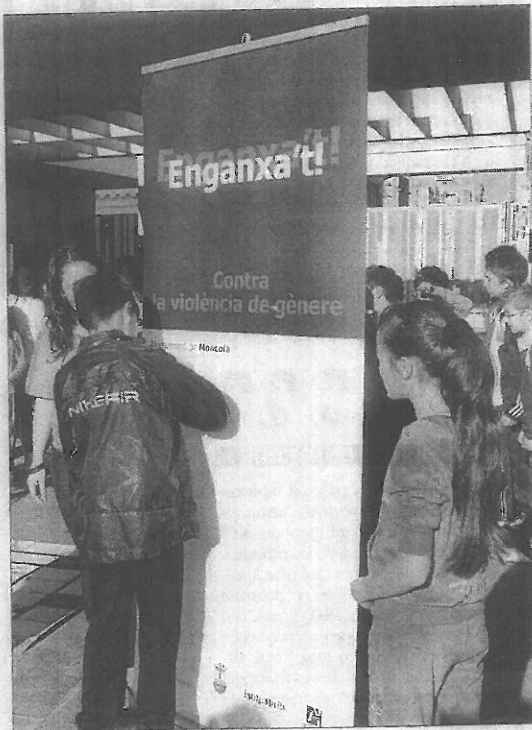
Los alumnos dejaron su firma en el panel de la campaña.

Alumnos y profesores se implicaron en esta actividad y lo siguen haciendo, puesto que el juego se ha quedado en el centro para conti-