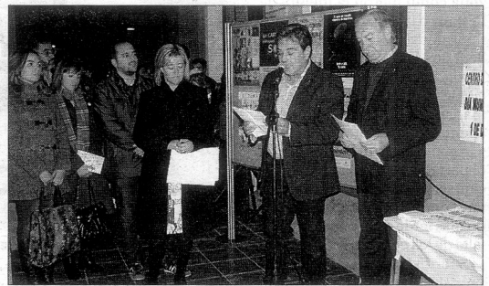
Vinaròs se sumó al Día Mundial contra el SIDA. ROSA MENGUAL