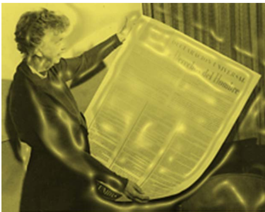
Eleanor Roosevelt sosteniendo la Declaración Universal de los Derechos Humanos en español.

Diplomática y activista por los derechos humanos. Fue Primera Dama estadounidense y esposa del Presidente de los Estados Unidos Franklin Delano Roosevelt. Considerada como una de las líderes que más ha influido en el siglo XX. Presidió el Comité de Derechos Humanos de la ONU y su papel fue clave en la aprobación en 1948 de la Declaración Universal de los Derechos Humanos.