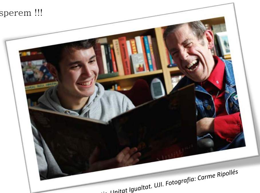
Els plaers de compartir. Unitat Igualtat. UJI.